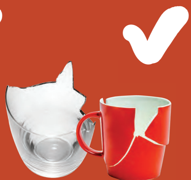
Đồ sành sứ và thủy tinh vỡ