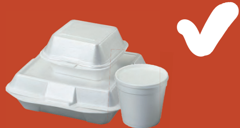
Hộp xốp và hộp đựng thức ăn mang về còn thừa đồ ăn