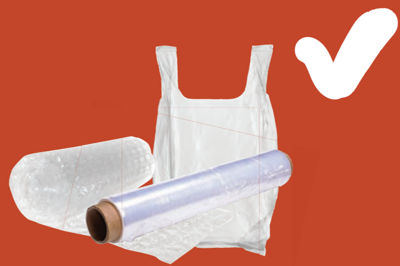
Túi nhựa/bao nylon và nhựa mềm (có thể tái chế tại siêu thị của bạn)