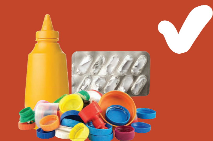
Tất cả các món đồ nhựa nhãn ghi 3, 4, 6 hoặc 7