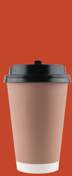
Ly cà phê và nắp đậy