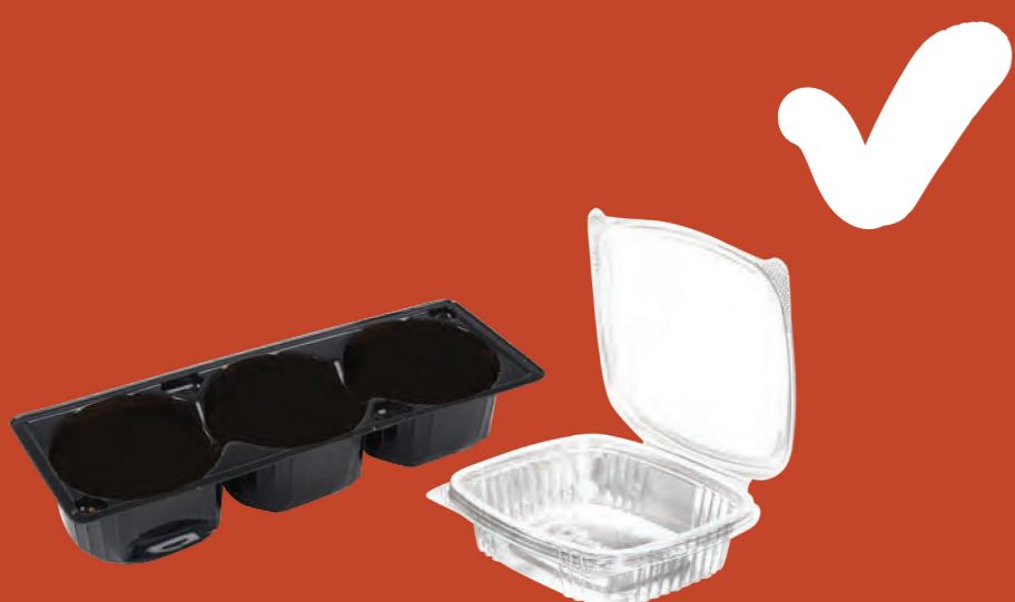
Tất cả các món đồ nhựa (nhãn ghi 1 và 2) mà không phải là chai nhựa