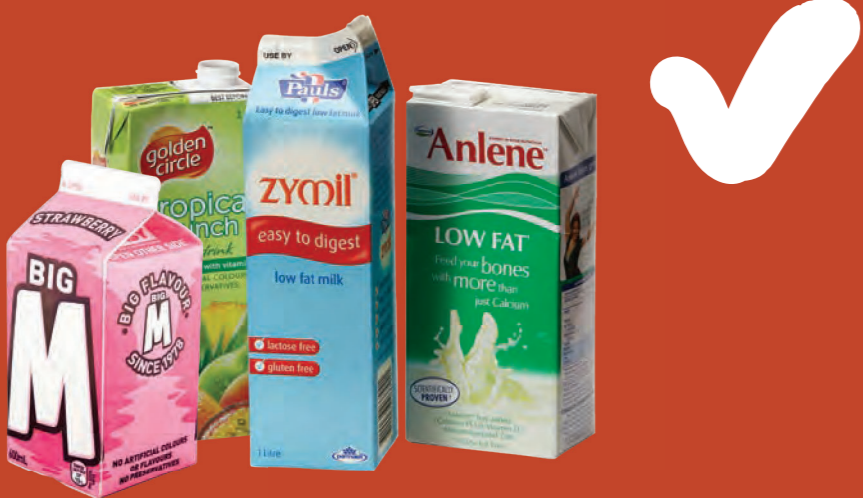
Hộp giấy đựng sữa và nước trái cây, bao gồm hộp Tetra Paks