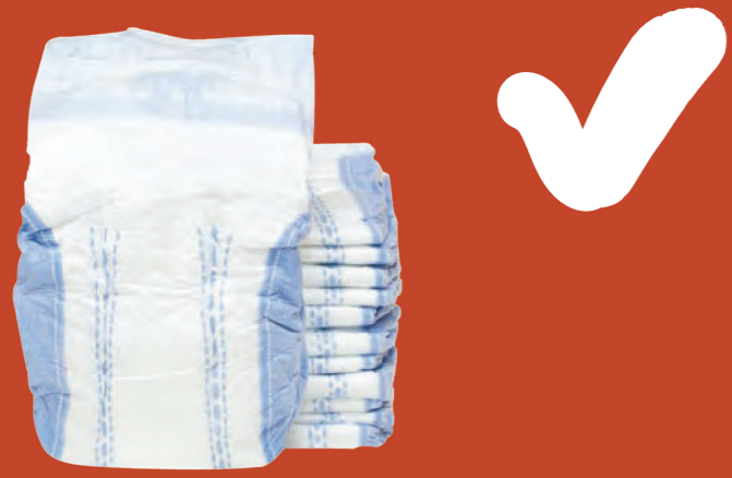
Tã lót và các sản phẩm vệ sinh