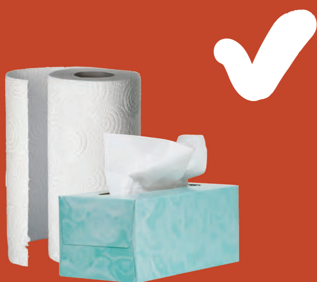
Khăn lau, khăn giấy và khăn ướt