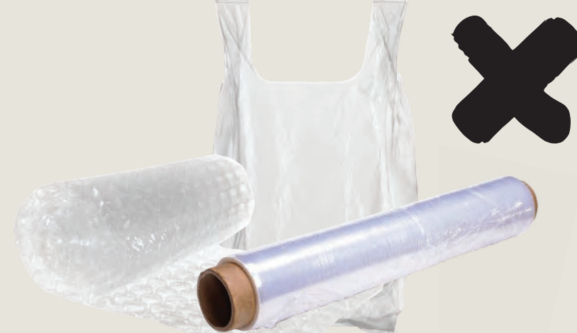
Πλαστικές σακούλες και μαλακά πλαστικά (μπορείτε να τα ανακυκλώσετε στο σουπερμάρκετ σας)