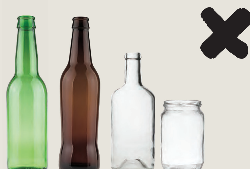
Γυάλινες φιάλες και γυάλες Αυτά μπορούν να απορριφθούν στον κάδο ανακύκλωσης γυαλιού χωρίς τα καπάκια τους