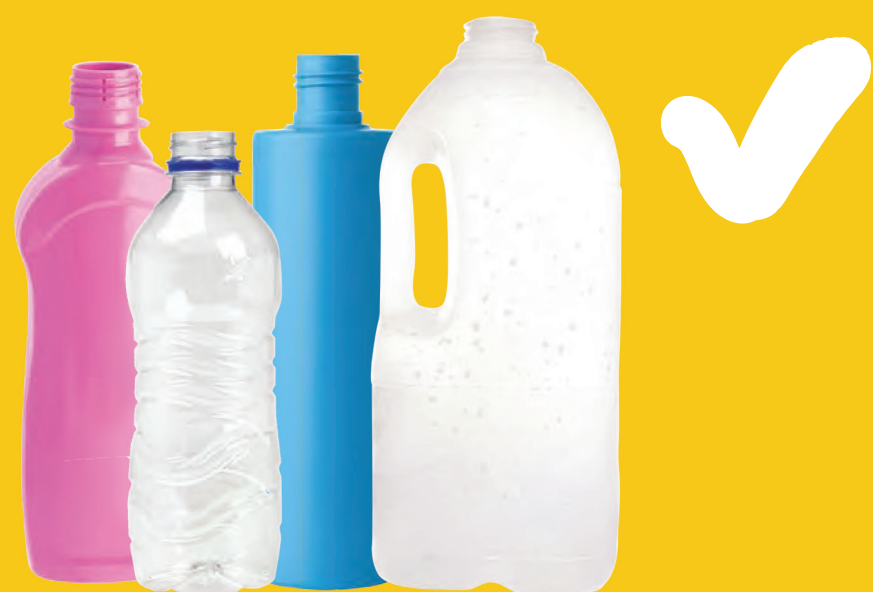
Πλαστικά μπουκάλια (με ετικέτα 1 και 2) χωρίς τα καπάκια