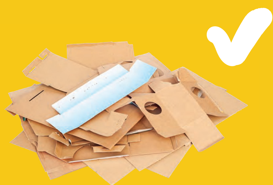
Χαρτί και συμπιεσμένο χαρτόνι