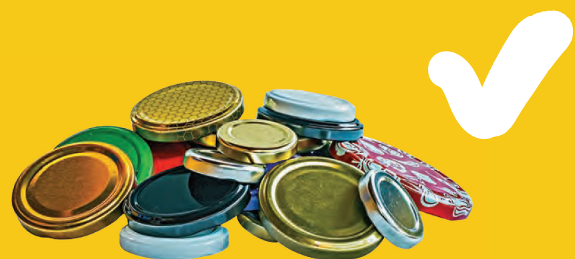
Μεταλλικά καπάκια από μπουκάλια και γυάλες