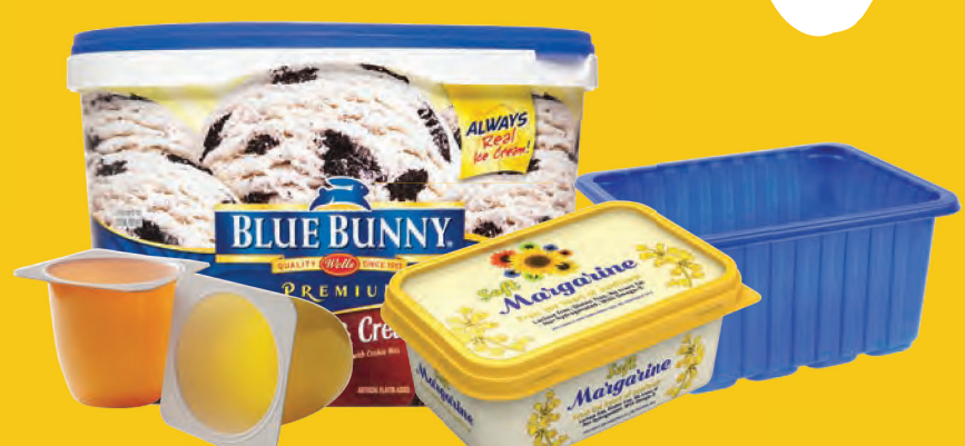
Πλαστική συσκευασία τροφίμων με την ένδειξη 5 μόνο, π.χ. δοχεία παγωτού, γιαουρτιού και βουτύρου, δίσκοι κρέατος