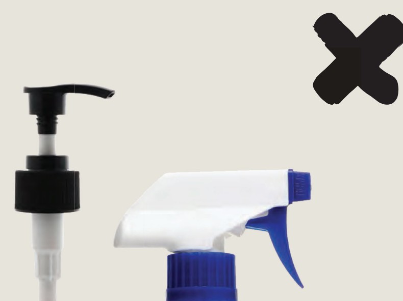
Καπάκια σπρέι και άλλα δοχεία «υπό πίεση», ψεκασμού και αντλίας