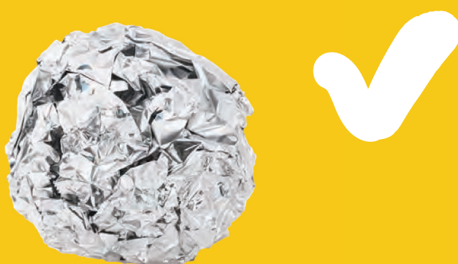
Αλουμίνιο κουζίνας, τσαλακωμένο σε μπάλα