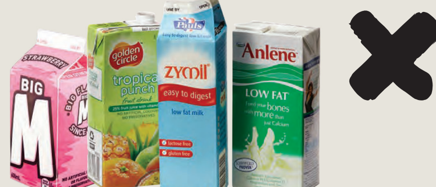
Κουτιά γάλακτος και χυμών, καθώς και Tetra Pak