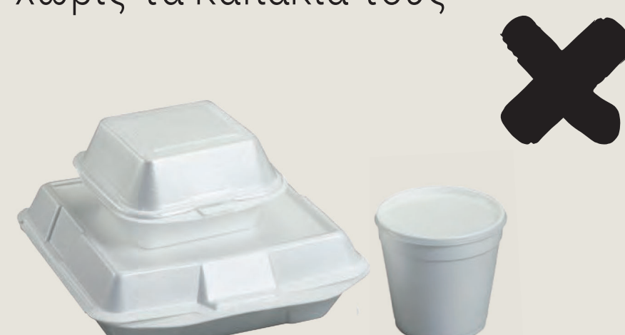
Σφουγγάρι, πολυστυρόλιο και φελιζόλ