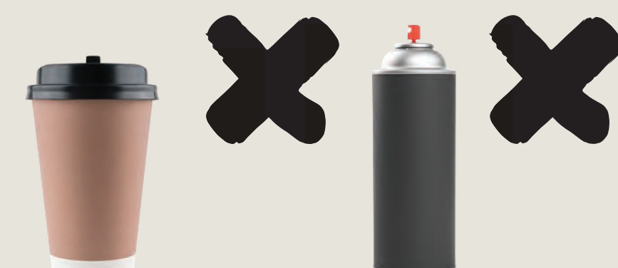
Φλυτζάνια καφέ Αερολύματα και καπάκια