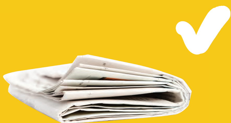
Εφημερίδες, ανεπιθύμητη αλληλογραφία και περιοδικά