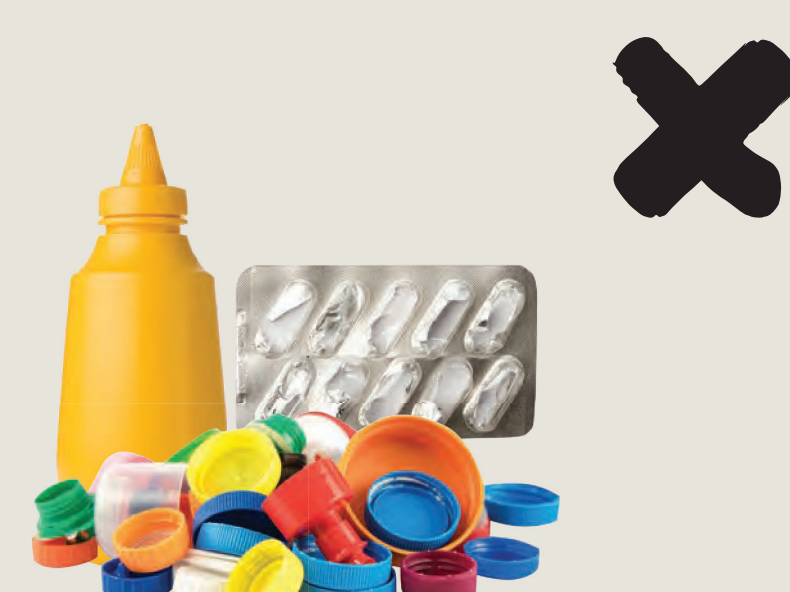
Όλα τα πλαστικά είδη με την ένδειξη 3, 4, 6 ή 7