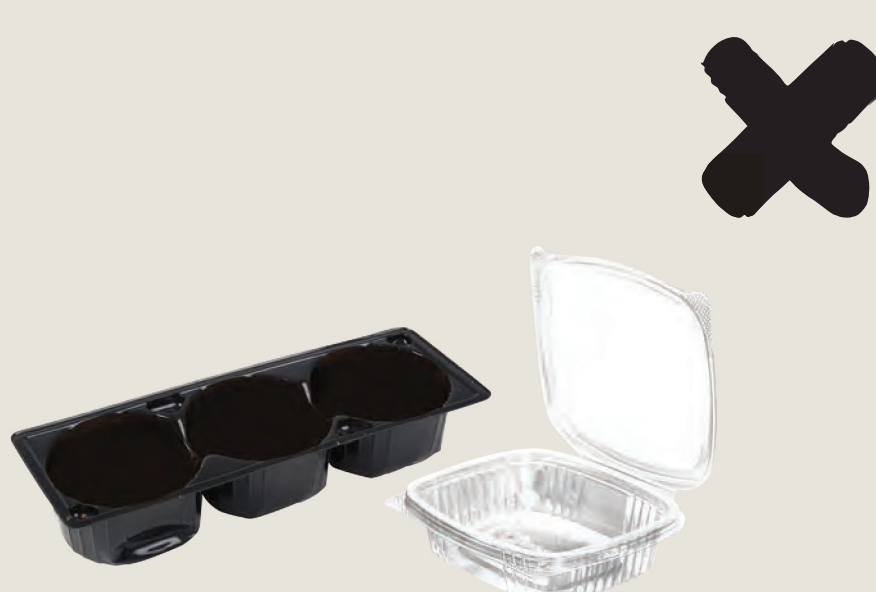
Όλα τα πλαστικά είδη (με την ένδειξη 1 και 2) τα οποία δεν είναι πλαστικά μπουκάλια