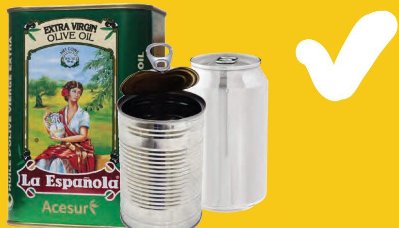
Κουτιά αλουμινίου και χάλυβα